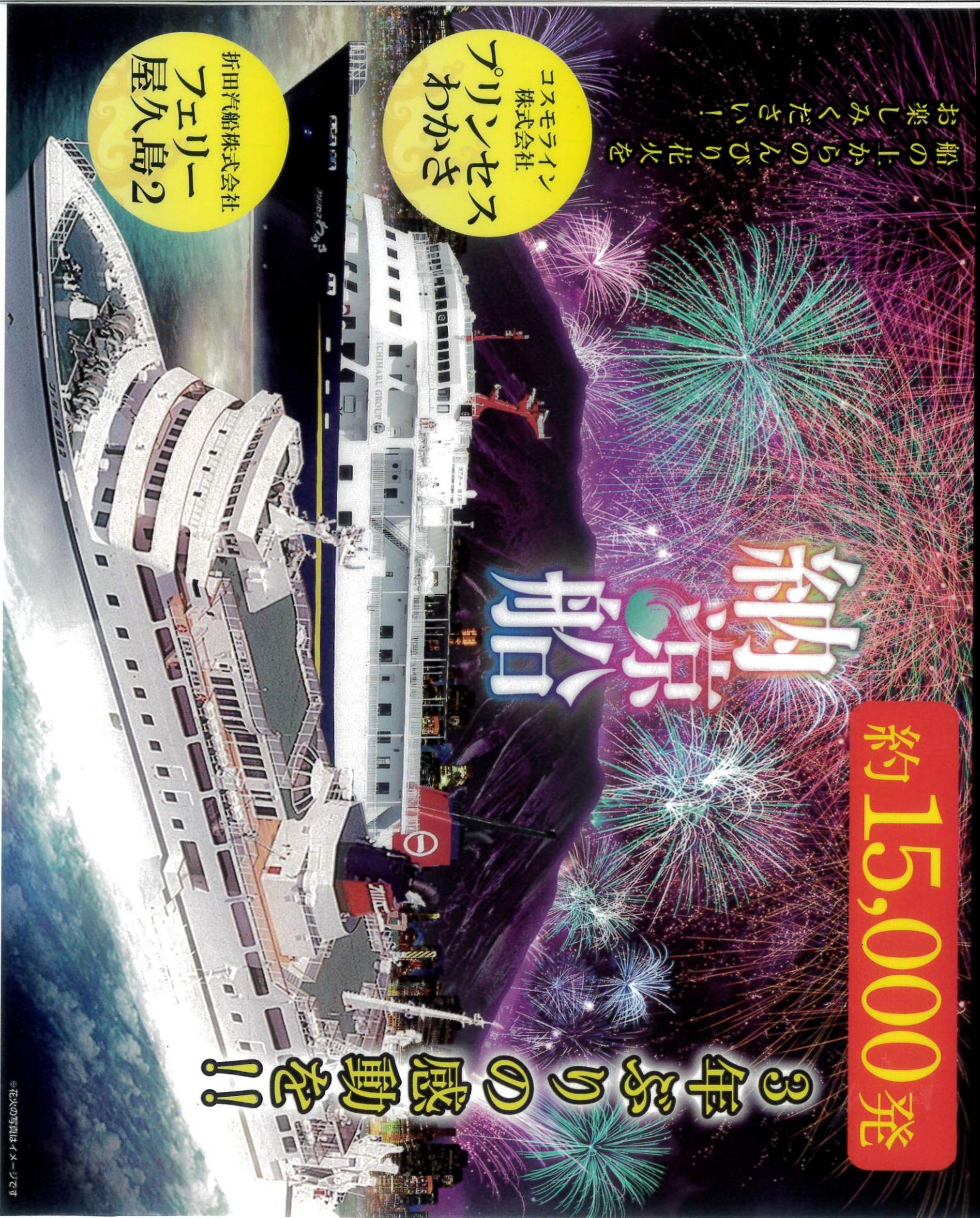
※花火の写真はイメージです