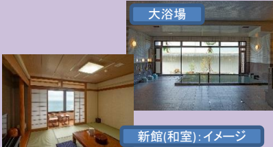
新館(和室):イメージ