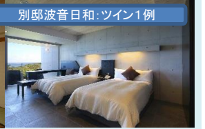
別邸波音日和:ツイン1例