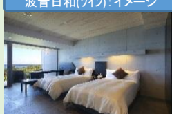
波音日和(ツイン):イメージ