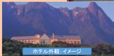
ホテル外観:イメージ