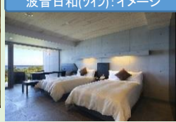
波音日和(ツイン):イメージ