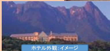
ホテル外観:イメージ