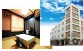
西之表地区：割烹ホテルいのもと