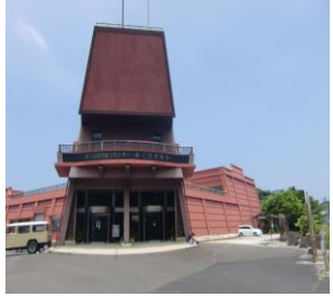
種子島開発総合センター鉄砲館